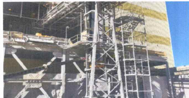
FOTOS DEL AREA DE TRABAJO